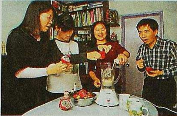
▼林生最愛在餐桌上大搞氣氛。

「我沒法陪太太買衫、教女兒功課，太太話我知化了粧，我笑言分辨唔到！我街只見物件的影，有次差點撞上前人攞着的鐵枝，若我再高5cm，左眼肯定沒了……好好彩。」講時林生哈哈笑，女兒謂爸爸時時都樂觀，是一明天會更好」的信徒。 林生回想，85年患上眼疾，正考完會計專業試，迫得把一切都放下，「我由幼稚園到中五，未試過考三甲以外，在會計師樓上司最睇好我，給我 longest Study leave，我一直認為自己天下無敵。」後來為了唸神學，他上課前要僱人把所有書錄下來學習，更要求人幫忙打字交功課，「我開始來學單，求人不是好受的事，因我自己從來毋須求人。」 林太強調除了常持正向心態，朋友的支援也很重要。「10年前丈夫曾患上淋巴癌，是我最低潮，因我害怕自己的情緒會影響丈夫和兩名女兒，過度壓抑令我工作時淚水也會不受控，但經教會朋友的開解，令我度過難關！」那次打擊也讓她體會到：人總會有分離的時候，最重要是珍惜可以相處的日子，「那刻就決定不要把唔開心的情緒帶回家，見到家人就是要開心的，故我回家前若有負面情緒，會先處理掉！」