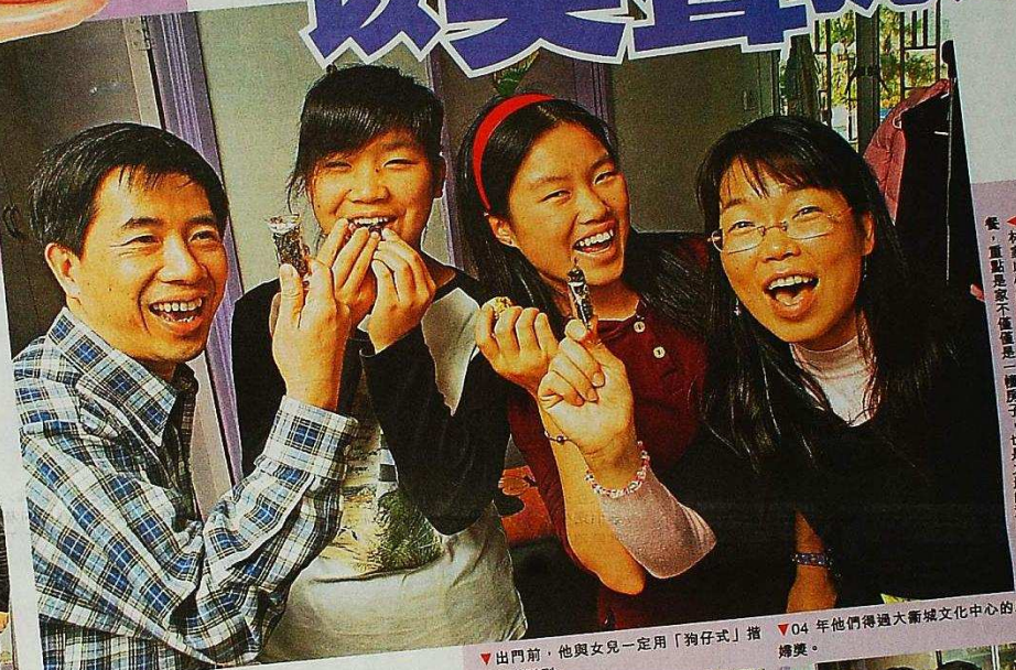
▲林家以快樂面對逆境，即使吃一粒糖，也會笑一餐，重點是敢不懼是「種房子」，也是力量的源泉。